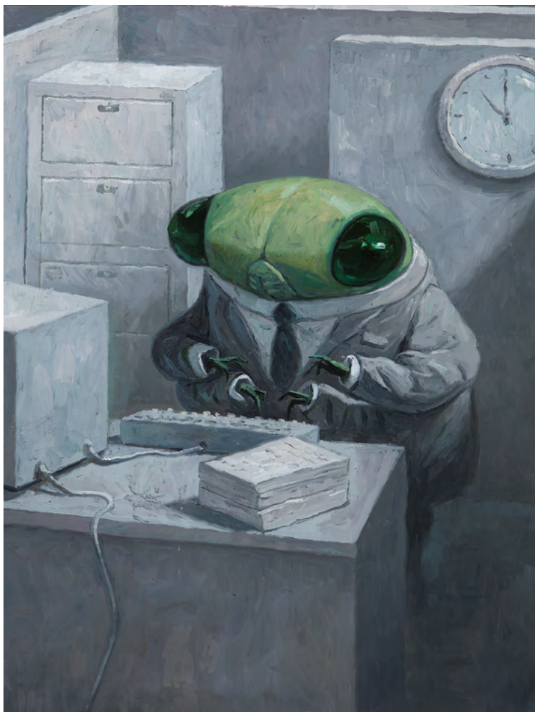
Shaun Tan: Zika-de. Ins Deutsche übersetzt von Eike Schönfeld. © 2019, Aladin in der Thienemann-Esslinger Verlag GmbH, Stuttgart.