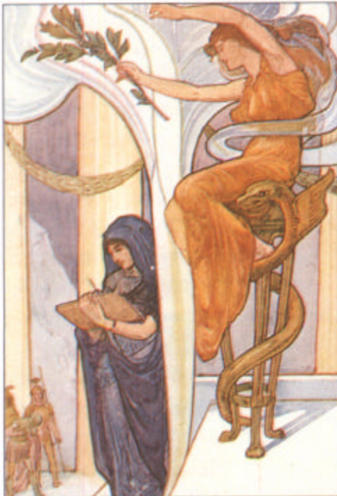
Orakel in Delphi

aus: Cotterell, Arthur, Die Enzyklopädie der Mythologie, Reichelsheim 2000, S. 41