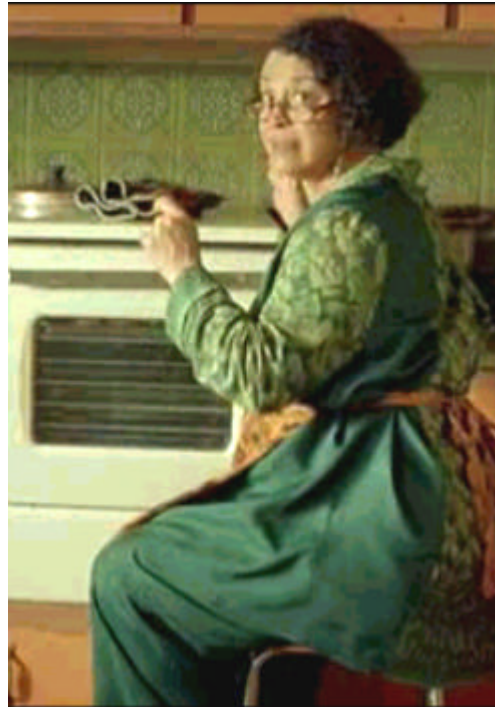
Das „Orakel“ in der „Matrix“