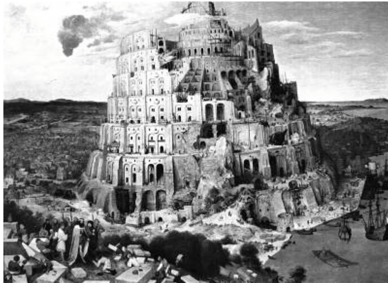
Pieter Bruegel, Der Turm zu Babylon, 1563