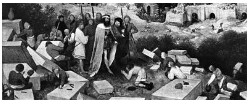
Pieter Bruegel, Der Turm zu Babylon, 1563